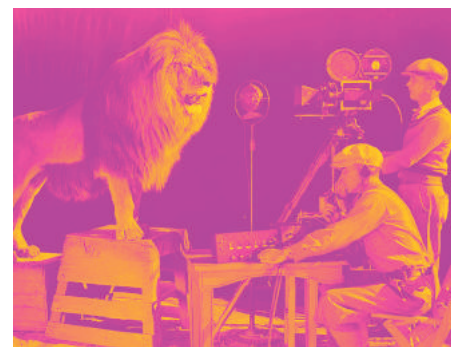
Gut gebrüllt, Löwe: Fast 100 Jahre war die Raubkatze Wappentier der MGM-Filmstudios

Landesarbeitsgemeinschaft (LAG) Jugendkunstschulen Die Webseite der Landesarbeitsgemeinschaft (LAG) Jugendkunstschulen und anderer kulturpädagogischer Einrichtungen in Berlin e.V. nennt alle zwölf Standorte und Kontaktdaten der hauptstädtischen Jugendkunstschulen und verlinkt auch dorthin: juks.de