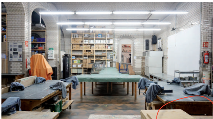
Beste Bedingungen: Juks Tempelhof-Schöneberg